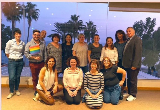
Întâlnirea echipei de proiect IENE 9 în Limassol, Cipru

Echipa de proiect a discutat despre planul website-ului și a fost de acord cu privire la utilizarea social media pentru proiect.